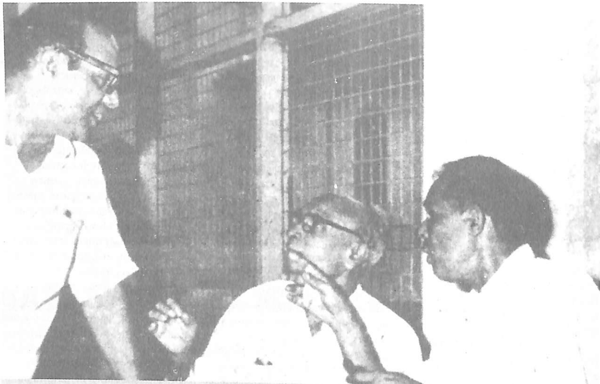
ഉറുബ്, ദേവ്, തക്ഷി

നതിനു സാധിച്ചിട്ടുണ്ട്. പൊതുവെ പ്രസാദാത്മകമായ ഒരന്തരീക്ഷമാണ് ഈ നോവലിലുള്ളത്. മനുഷ്യന്റെ ഭാവിയെക്കുറിച്ചുള്ള ഉടയാത്ത വിശ്വാസമാണ് ആ അന്തരീക്ഷസൃഷ്ടിയുടെ ചാലകശക്തി. ഇങ്ങനെ ഒരു അന്തരീക്ഷം വളർത്തിയെടുക്കാവുന്ന അനുകൂല പരിസ്ഥിതി അനുണ്ടായിരുന്നുവെന്ന് ഉറുബ് തന്നെ വിശദീകരിക്കുന്നുണ്ട്. നവോത്ഥാനം കേരളത്തിലുണ്ടാക്കിയ ഉണർവുകൾക്കു ശേഷമുണ്ടായ ദേശീയ പ്രസ്ഥാന പ്രവർത്തനങ്ങളും ഗാന്ധിയൻ ആദർശങ്ങളും റഷ്യൻ വിപ്ലവം ഉണ്ടാക്കിയ അനുരണനങ്ങളുമാണ് ഈ അവസ്ഥകൾ. അവ ഈ നോവൽ കഥാഘടനയിലും കഥാപാത്രങ്ങളിലും സന്നിവേശിപ്പിച്ചിട്ടുണ്ട്.